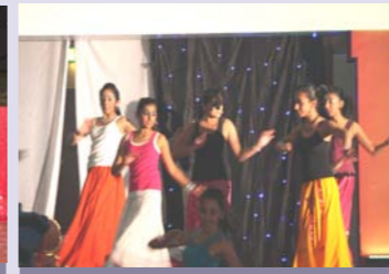
ફાયર એન્ડ આઈસ ખાતે યુવા વર્ગ