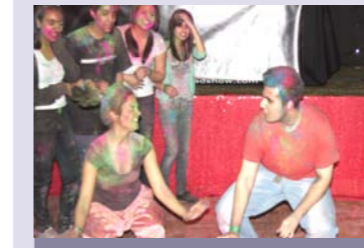
પેવેલ્યન ખાતે ઉત્સવો

ગત વર્ષના આયોજીત આ મહત્વના પ્રસંગો ઉપરાંત ફાયરે કલબ, મેળા, ૬૦ વર્ષથી વધુ ઉમર ધરાવતા વડીલો માટેના ભોજન, બાળકોની નાતાલ મિજલસ, દરિયા કિનારેનુ પર્યટન આયોજીત કર્યુ હતુ. વાર્ષિક ઉજવાતા આવા કેટલાક પ્રસંગોમાં જનસંખ્યા જરા ઓછી લાગી તેથી અમો નિરાશ થયા. પ્રસંગોના આયોજન માટે પ્રાથમિક તૈયારી, વ્યવસ્થા, પરિશ્રમ અને વિચાર શક્તિ ખૂબ માંગી લે છે. તો ૨૦૦૯ વર્ષમા જનસંખ્યાની ઊણપ આવવા દેશો નહીં! સૌ સંઘાથે