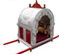
• Mogul Doli

NEW for 2009 and 2010 Golden Palki and Wooden Carved Doli