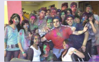
Festival at the Pavilion