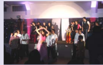
Fire and Ice