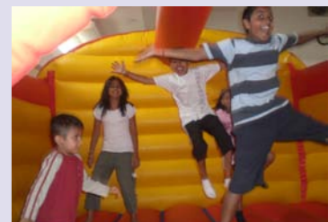
Masti at Mela