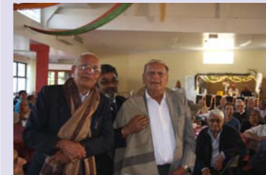
૬૦ વર્ષ ઉપરના વડીલોનુ સન્માન