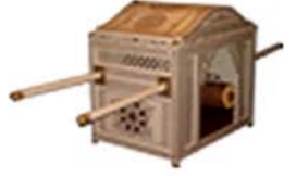
• Princess Doli

Enter your wedding like a princess on your special day. Make a grand entrance in a uniquely designed Doli or Palki.