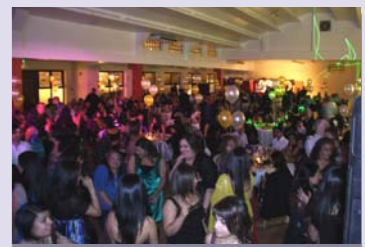
Celebration at New Year