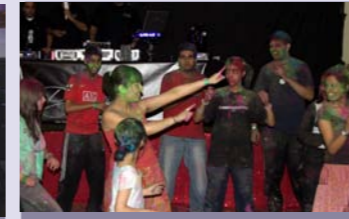
Joy at Holi

2008, another triumphant year at the Mandal. This has been a year of great successes, lots of fun, new projects and new blood. Our most successful events last year were Fire & Ice and our Holi party. Both of these were organised and delivered by our youth. Those who attended enjoyed the events and had lots of fun. Such events build links with our children, promote our culture, and religious festivals. Despite all the great events we delivered last year: Friday Club, Mela, 60+ dinner, Children's Christmas Party, New Years Eve, Seaside trips, we are disappointed to see low turnouts on some of our annual events. A lot of preparation, effort and thought are put into delivering these events, so ensure you do not miss out in 2009!