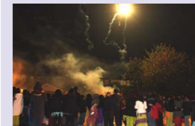
Fireworks at Diwali

For your feedback please write to us at The Darji Pavilion, 26 Oakthorpe Road, N13 5JL or email bharat.t.tailor@bt.com