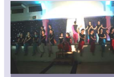
ફાયર એન્ડ આઈસ ખાતે યુવા વર્ગ