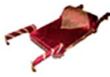
• Wedding Doli