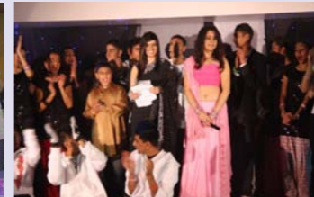
Youth at Fire and Ice