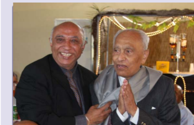
Respect at 60+